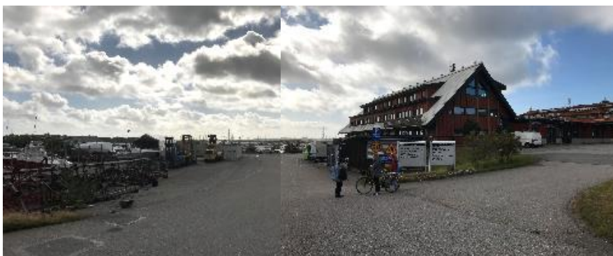
Bild. Foto, vy från norr med infarten från Hälleflundregatan, befintligt verksamhetshus till höger och småbåtshamnen skymtas i bakgrunden.

En detaljplan för bostäder och verksamheter vid Hälleflundregatan tas nu fram av Stadsbyggnadsförvaltningen med syfte att omvandla detta område från ett verksamhetsområde till en förlängning av den bostadsbebyggelsestruktur som vuxit fram utmed Fiskebäcks hamnområde. Här ämnas dock även ges ett utrymme för befintliga verksamheter att delvis vara fortsatt verksamma på plats samt möjlighet för nya att etablera sig. Fastigheten Fiskebäck 8:1, som omfattar planområdet, uppfattats som öppen av boende som promenerar genom området samtidigt som småbåtshamnens verksamhet har pågått då med risker att beträda området. Idag (under 2023) har fastigheten stängslats in.