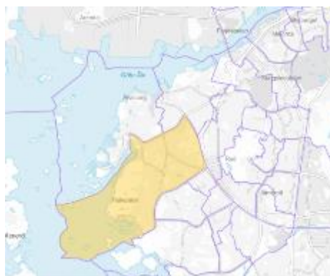
Karta indelad i Primärområden där Fiskebäck är markerad.

Bostadsbyggande mellan 2006–2018 har bestått av bostadsrätter. Under 2010-talet vid hamnen väster om aktuellt planområde, kompletterades området med flerbostadshus innehållandes 160 bostadsrätter.